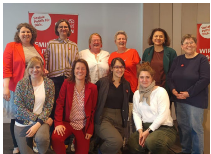
Die neue Vorstandschaft der SPD Frauen Baden-Württemberg.

Mit der Wahl des neuen Landesvorstands und klaren politischen Positionen setzen die SPD Frauen Baden-Württemberg ein unmissverständliches Zeichen: Gleichstellung ist kein Nebenprojekt – sondern Voraussetzung für eine gerechte und demokratische Gesellschaft. Die Delegiertenkonferenz machte deutlich, dass dieser Anspruch nicht nur programmatisch, sondern auch organisatorisch fest verankert ist.