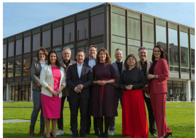
Die neue SPD-Fraktion vor dem Landtag in Stuttgart.