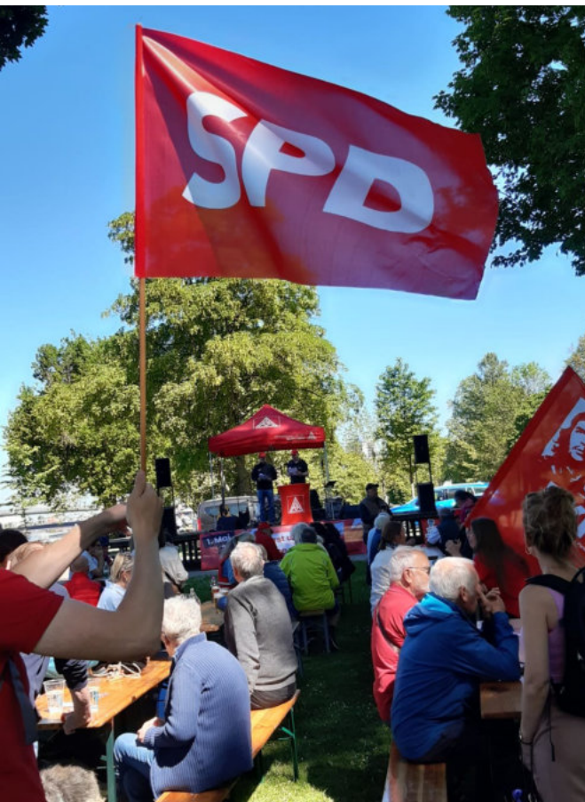
Die SPD Ortenau war bei der Maikundgebung 2026 des DGB mit mehreren Ortsvereinen vertreten. Es hätten aber gerne auch noch mehr SPDler Flagge zeigen können.