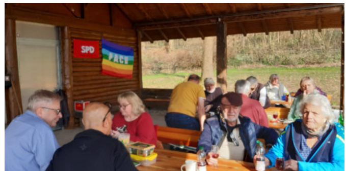
Guter Besuch des Waldspeckessens der SPD Hohberg.

Während am Feuer gegrillt und gelacht wurde, nutzten viele die Gelegenheit zum intensiven Austausch. Mit Spannung wurde dabei auch das Ergebnis der Landtagswahl erwartet, das im Laufe des Nachmittags eintraf.