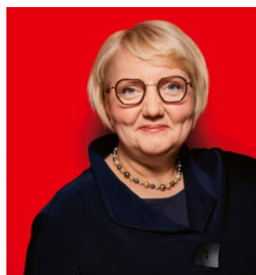
Katja Mast (MdB)

Die jüngsten Wahlergebnisse stimmen nachdenklich. Umso wichtiger ist jetzt eine klare politische Ausrichtung: Die SPD muss wieder eindeutig Partei der Arbeit sein. Der Maßstab unseres Handelns muss der Alltag derjenigen sein, die dieses Land am Laufen halten.